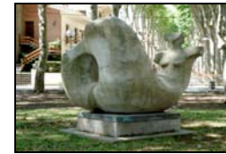
5. Volum convex II, 1985 Serra Puigvert, Rosa Plaça Amèrica