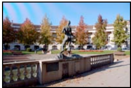
1. Font de Santa Magdalena, 1988 Planella Domènech, Santiago Plaça Manuel Malagrida