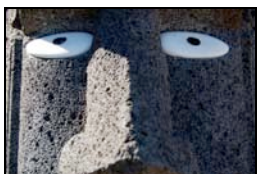
3. Moai, 1984 Tuki, Manuel Plaça de l'illa de Pasqua